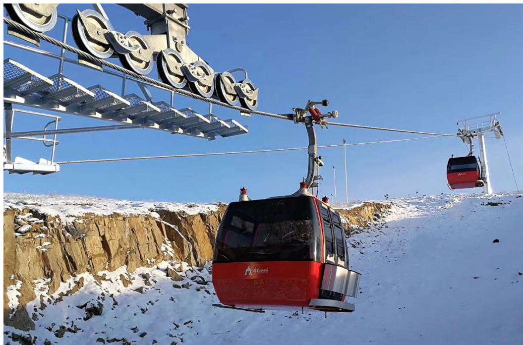
TPM 6-8 Personen in Altay, China

In den letzten Jahren konnte der Schweizer Seilbahnhersteller Bartholet viele spannende Projekte realisieren, die die Seilbahnbranche weiter vorangetrieben haben. Der Erfolg des Unternehmens lässt sich aber nicht nur durch die vielfältigen Projektlösungen und durch die geografische Expansion erkennen, sondern auch durch die Mitarbeiterentwicklung der letzten Jahre. So hat sich die Anzahl der Mitarbeiter in den letzten zehn Jahren auf über 400 mehr als verdoppelt.