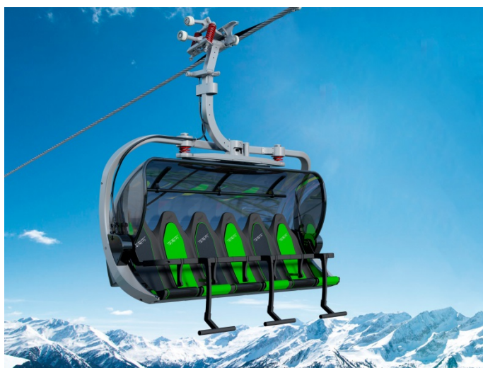
6er Sessel Thaiwoo

Im Skigebiet Thaiwoo baut Bartholet momentan eine neue 6er-Sesselbahn. Als Zubringer aus der Grossstadt Peking dient künftig eine Hochgeschwindigkeitsbahn, welche direkt nach Thaiwoo führt und in Zukunft deshalb noch mehr Touristen bringen soll. Die Sesselbahn mit 2 Sektionen geht noch diesen Dezember in Betrieb und wird über eine Förderleistung von 2400 Personen pro Stunde verfügen. Die Sessel im