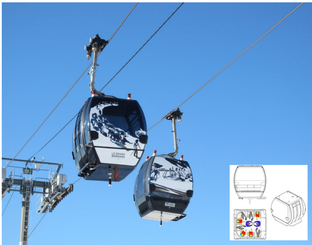
Neue Kabinenform mit einmaligem Kabinendämpfungssystem von Barholet AG

Für das künstlerische Design der neuen Gondeln wurden verschiedene alte Bilder von Grand Bornand ausgewählt. Das Spezielle daran ist, dass für die Bilder auf den Gondeln nur zwei Farben verwendet wurden. Diese Bilder wurden mittels weissen Folien und den dunkeln Fenstern der Gondeln so veranschaulicht, dass das Motiv gut sichtbar wurde. Für jede Gondel gibt es zwei verschiedene Motive (vorne und hinten). So haben die 55 Gondeln alle ein individuelles Sujet bekommen.