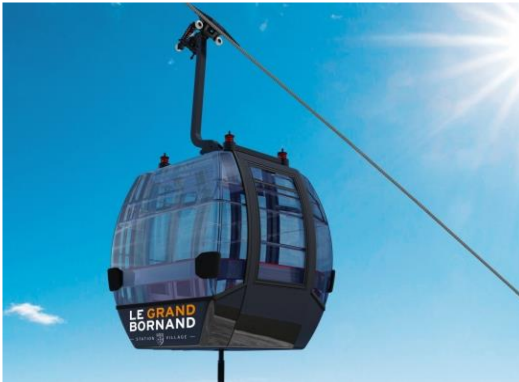
Rendering Gangloff Cabins AG