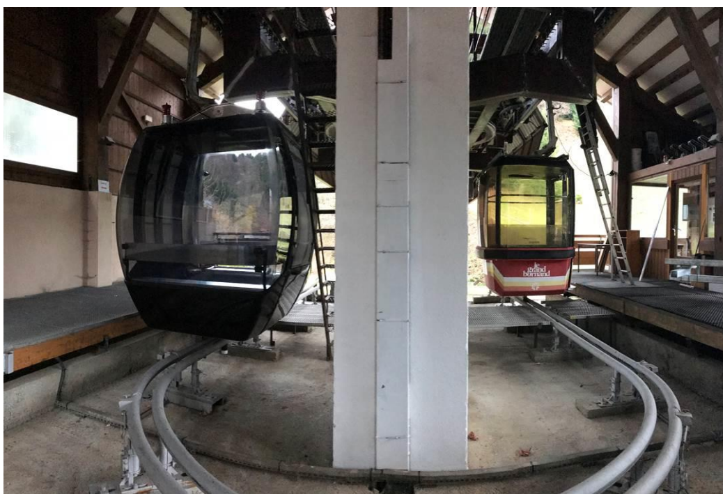
Vergleich neue und alte Kabine